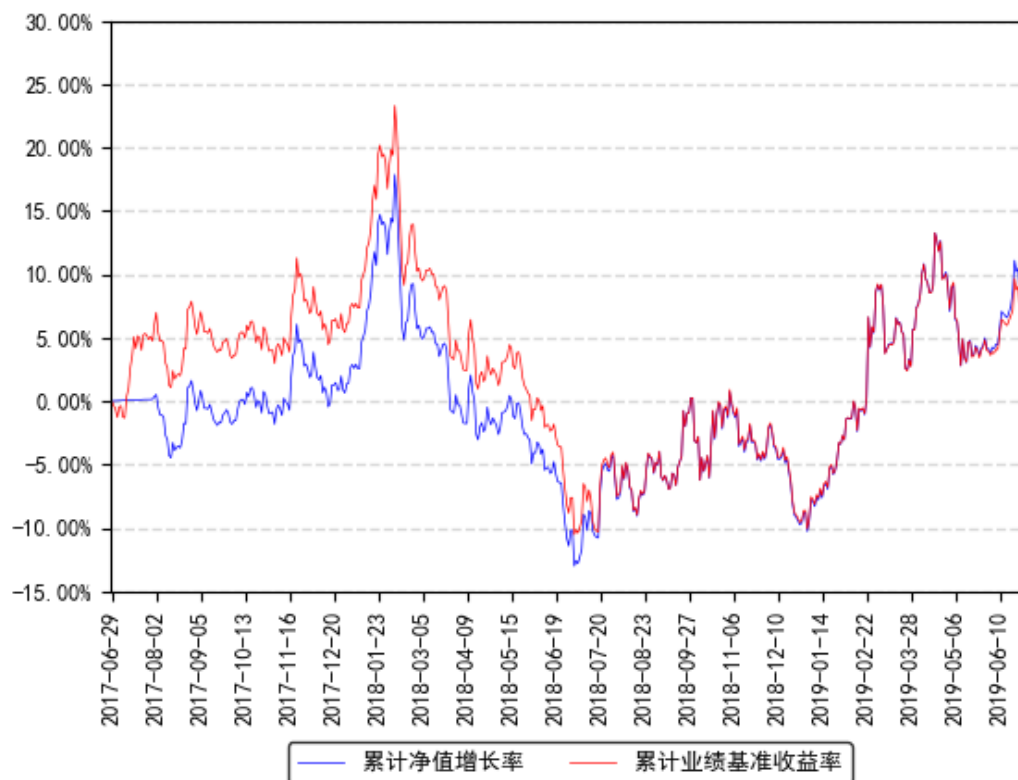
南方银行联接A累计净值增长率与同期业绩比较基准收益率的历史走势对比图