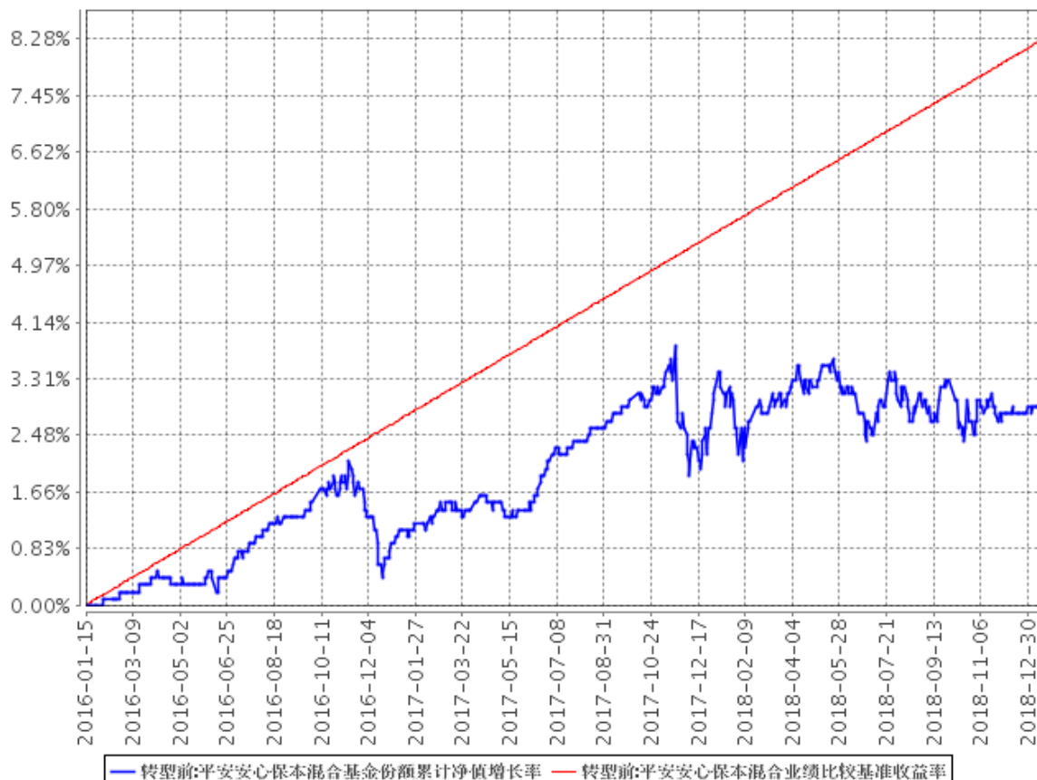
平安安心保本混合基金份额累计净值增长率与同期业绩比较基准收益率的历史走势对比图