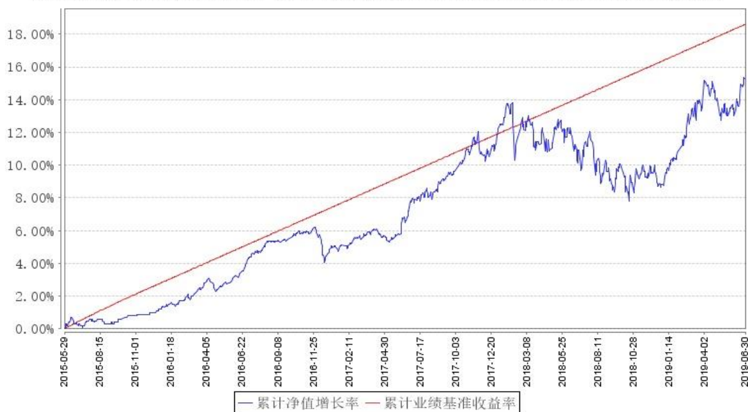
鹏华弘益混合A累计净值增长率与同期业绩比较基准收益率的历史走势对比图