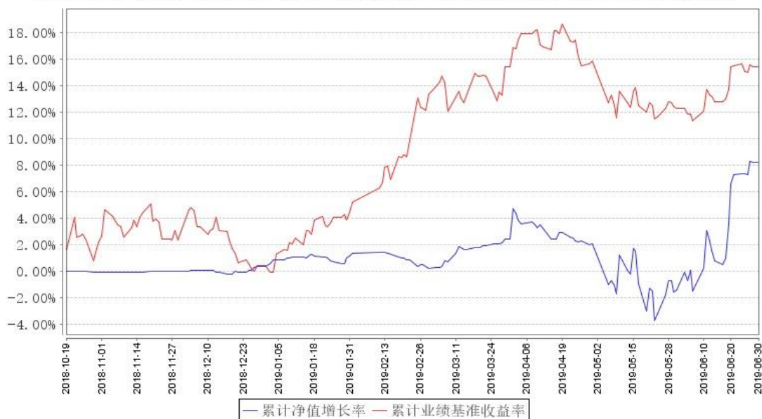
鹏华金鼎混合A累计净值增长率与同期业绩比较基准收益率的历史走势对比图