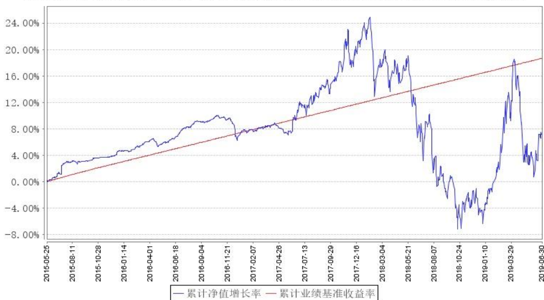
鹏华弘华混合A累计净值增长率与同期业绩比较基准收益率的历史走势对比图