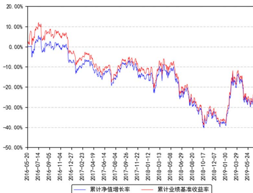
南方创业板ETF联接累计净值增长率与同期业绩比较基准收益率的历史走势对比图