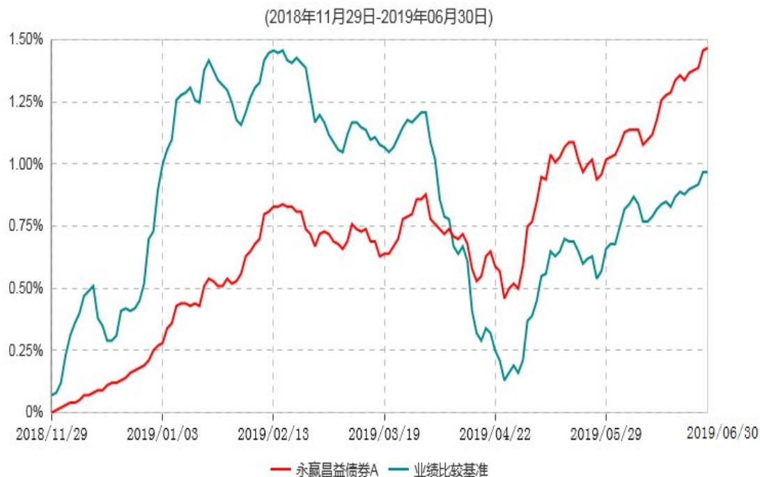
永赢昌益债券A累计净值增长率与业绩比较基准收益率历史走势对比图

注：1、本基金合同生效日为 2018 年 11 月 29 日，截至本报告期末本基金合同生效未 满 1 年；