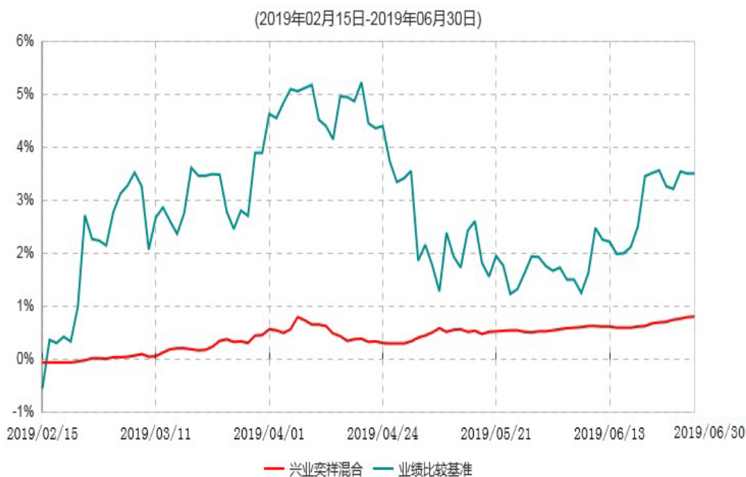
兴业奕祥混合型证券投资基金累计净值增长率与业绩比较基准收益率历史走势对比图

注：1、2019年2月11日，兴业保本混合型证券投资基金的第一个保本周期到期。根据基金合同的约定，因未能符合保本基金存续条件，兴业保本混合型证券投资基金自2019年2月15日（即保本期到期操作期间截止日的次日）起转型为非保本的混合型基金，转型为“兴业奕祥混合型证券投资基金”，《兴业奕祥混合型证券投资基金基金合同》亦于该日同时生效。兴业保本混合型证券投资基金报告期自2019年1月1日至2019年2月14日止，兴业奕祥混合型证券投资基金报告期自2019年2月15日至2019年6月30日止。