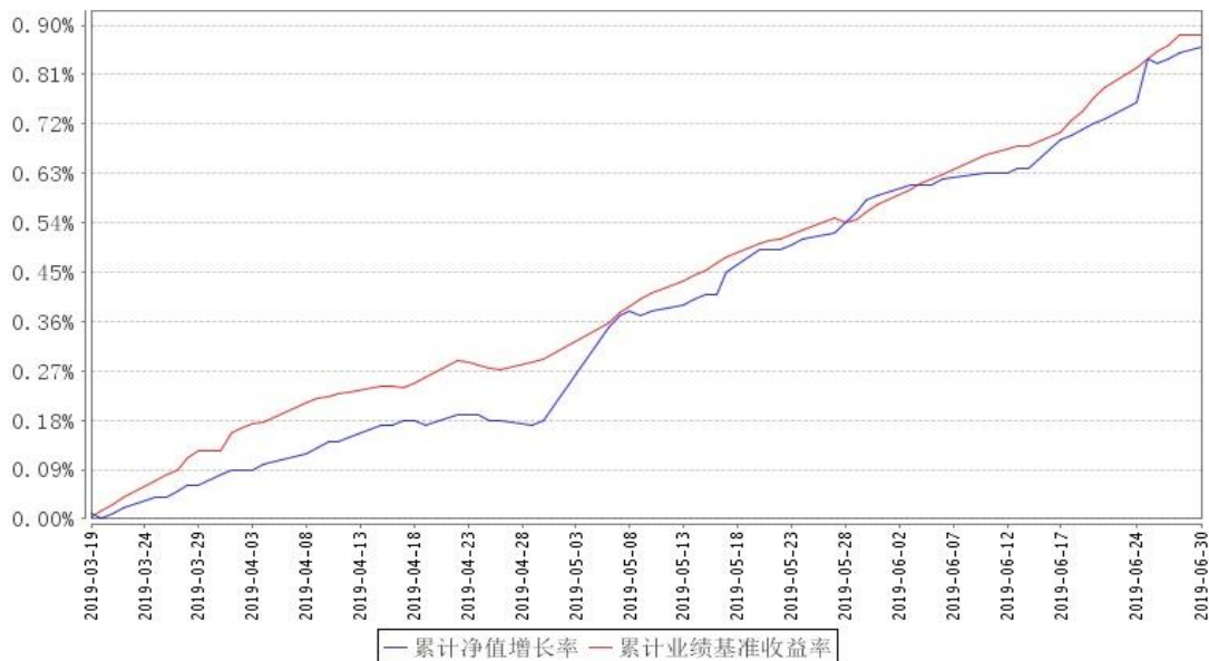
融通超短债债券A累计净值增长率与同期业绩比较基准收益率的历史走势对比图