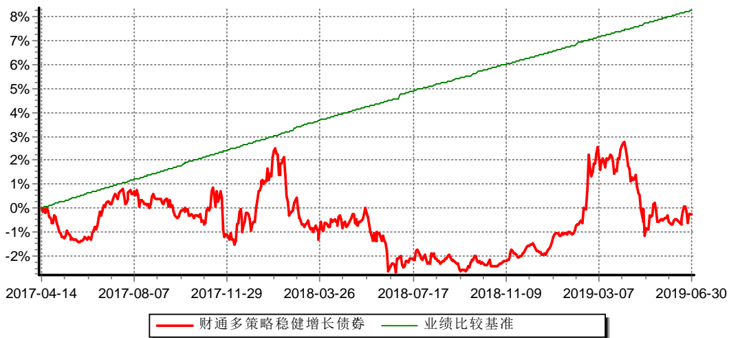
财通多策略稳健增长债券型证券投资基金C 累计净值增长率与业绩比较基准收益率历史走势对比图 (2017年4月14日-2019年6月30日)

(4) 本基金自2017年4月14日起增设收取销售服务费的C类份额，原份额变更为A类份额。