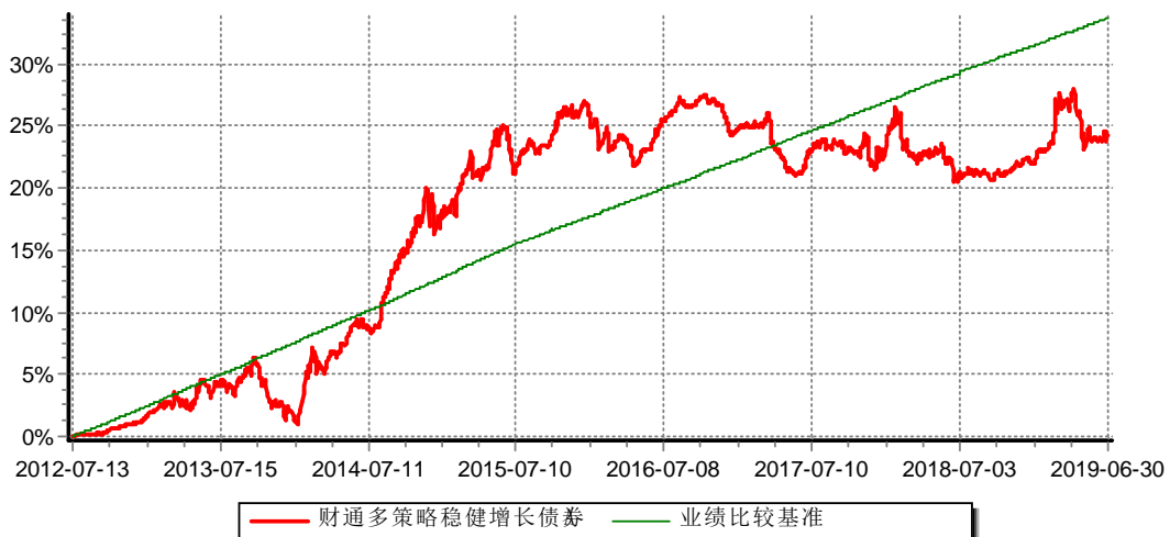
财通多策略稳健增长债券型证券投资基金A 累计净值增长率与业绩比较基准收益率历史走势对比图 (2012年7月13日-2019年6月30日)