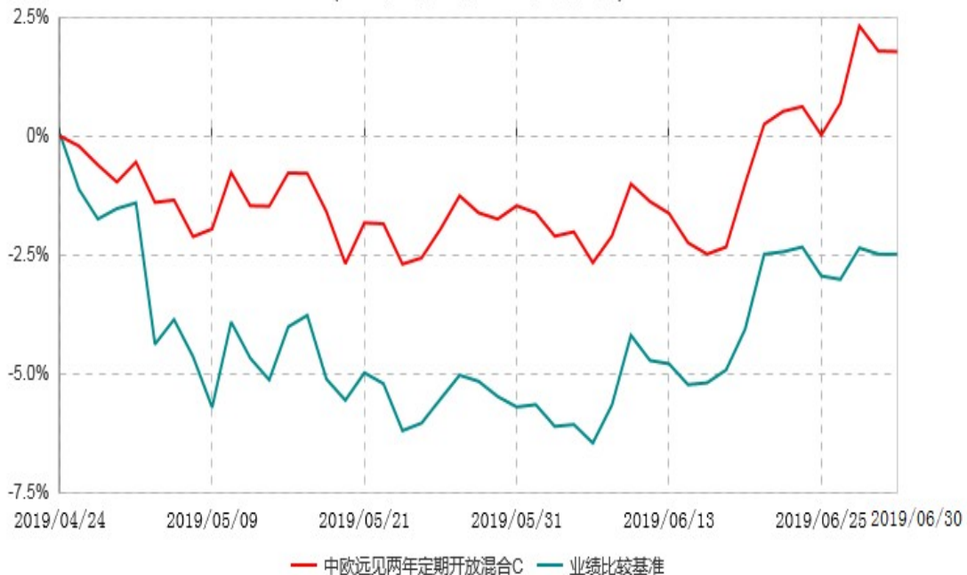
中欧远见两年定期开放混合C累计净值增长率与业绩比较基准收益率历史走势对比图 (2019年04月24日-2019年06月30日)

注：本基金基金合同生效日期为 2019 年 04 月 24 日，自基金合同生效日起到本报告期末不满一年，按基金合同的规定，本基金自基金合同生效起六个月为建仓期，建仓期结束时各项资产配置比例应当符合基金合同约定。