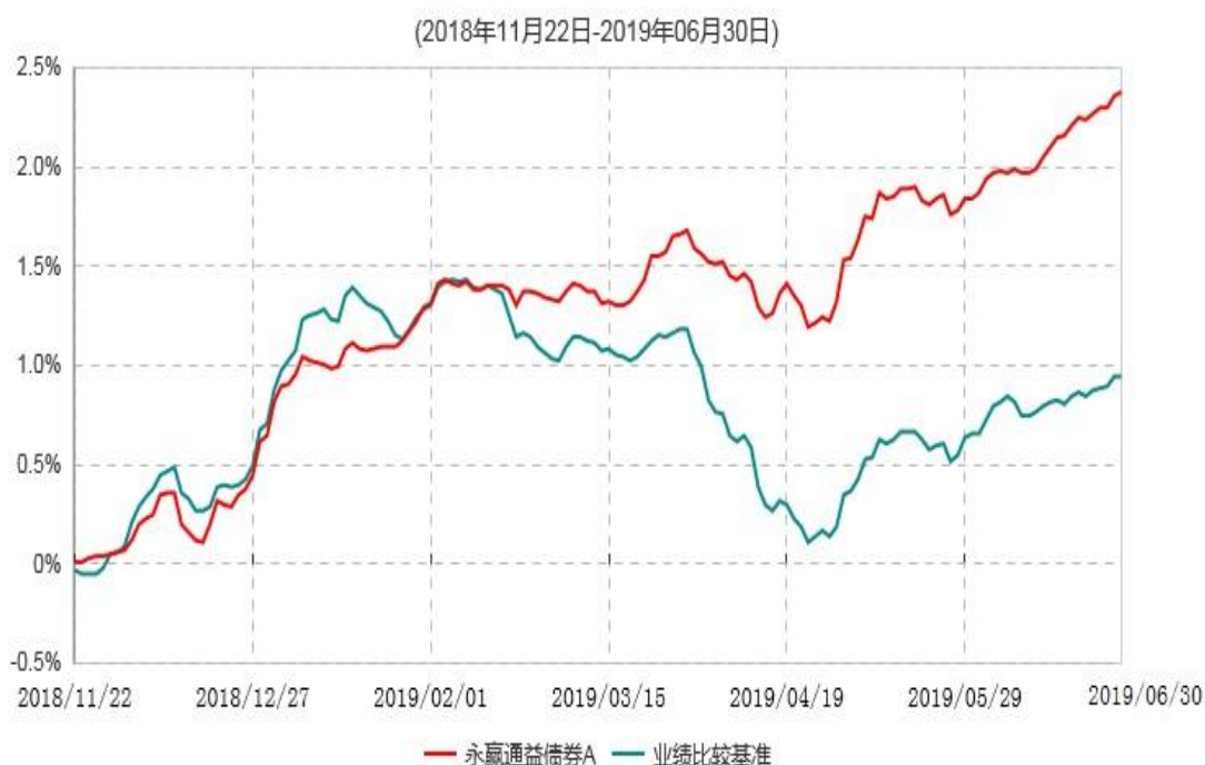
永赢通益债券A累计净值增长率与业绩比较基准收益率历史走势对比图

注：1、本基金合同生效日为 2018 年 11 月 22 日，截至本报告期末本基金合同生效未满 1 年； 2、本基金在六个月建仓期结束时，各项资产配置比例符合合同约定。