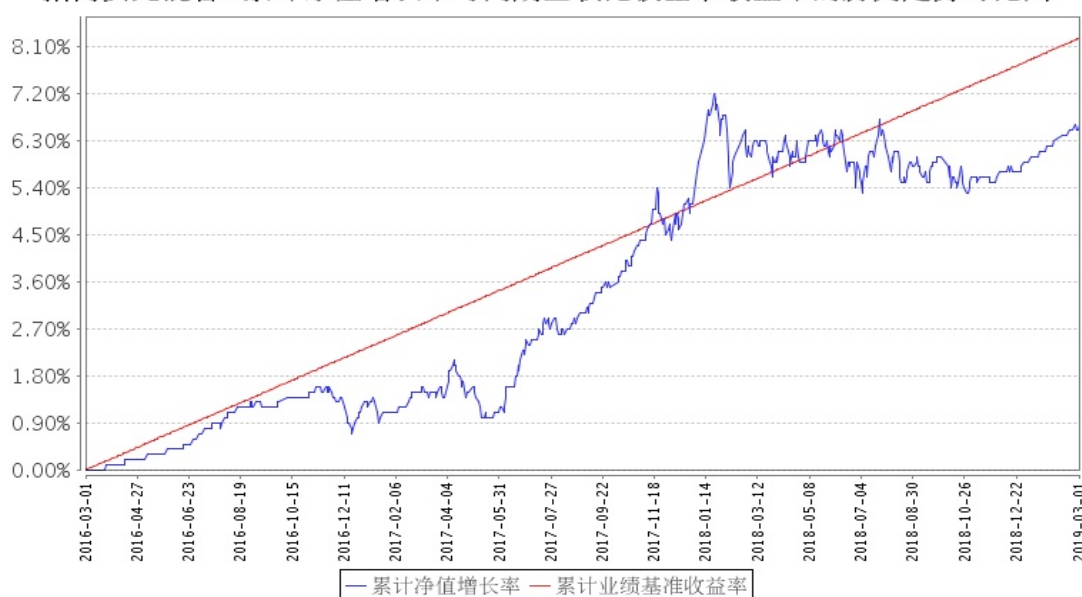
招商安元混合A累计净值增长率与同期业绩比较基准收益率的历史走势对比图

注：根据《招商安元保本混合型证券投资基金基金合同》的有关规定，2019年3月1日为招商安元保本混合型证券投资基金的第一个保本周期到期日，自2019年3月2日招商安元保本混合型证券投资基金转型为招商安元灵活配置混合型证券投资基金，因此上图本报告期间的结束日为2019年3月1日。