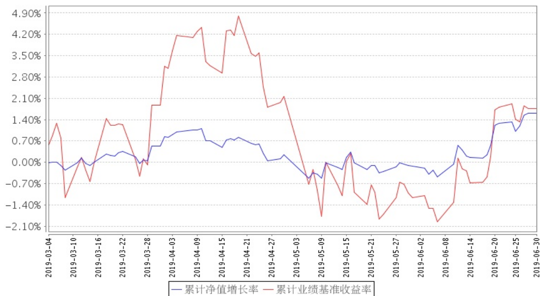
招商安元混合A累计净值增长率与同期业绩比较基准收益率的历史走势对比图