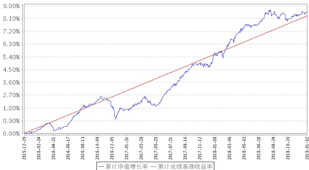
招商安弘混合累计净值增长率与同期业绩比较基准收益率的历史走势对比图