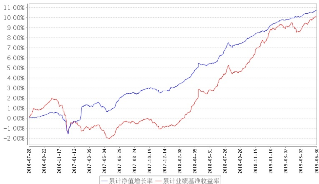
招商招裕纯债A累计净值增长率与同期业绩比较基准收益率的历史走势对比图