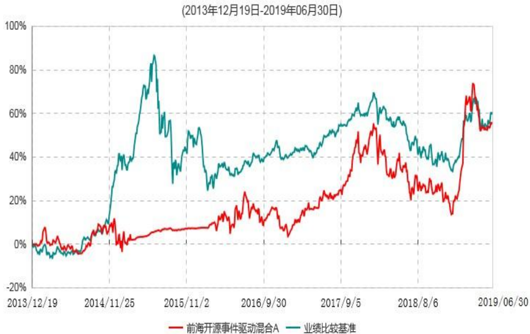
前海开源事件驱动混合A累计净值增长率与业绩比较基准收益率历史走势对比图