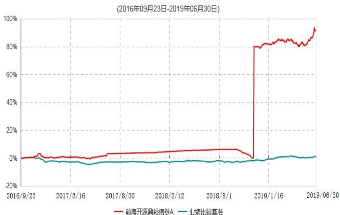
前海开源鼎裕债券A累计净值增长率与业绩比较基准收益率历史走势对比图