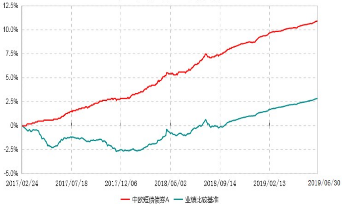
中欧短债债券A累计净值增长率与业绩比较基准收益率历史走势对比图 (2017年02月24日-2019年06月30日)

注：自 2018 年 10 月 25 日起，变更业绩比较基准至中债综合财富（1 年以下）指数收益率。