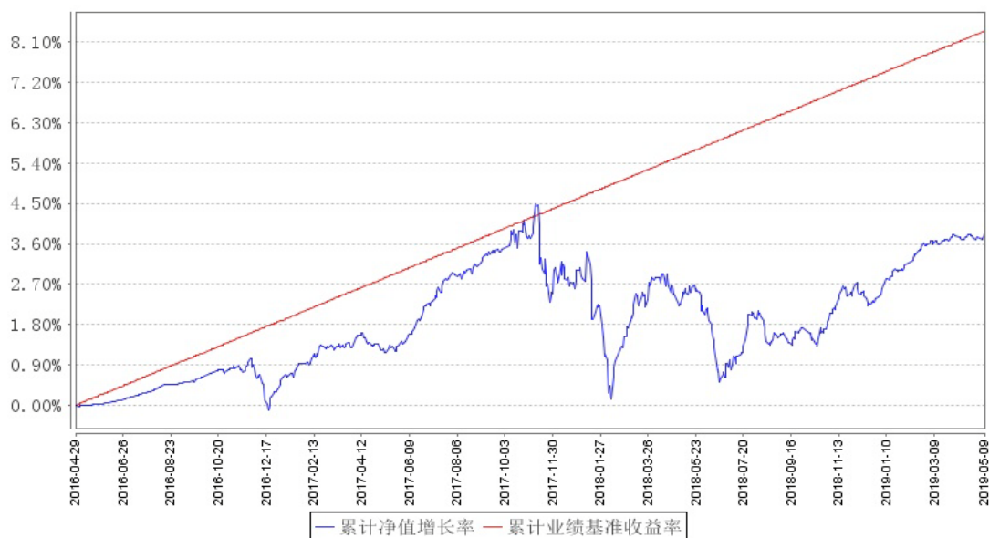
中银证券保本1号混合累计净值增长率与同期业绩比较基准收益率的历史走势对比图