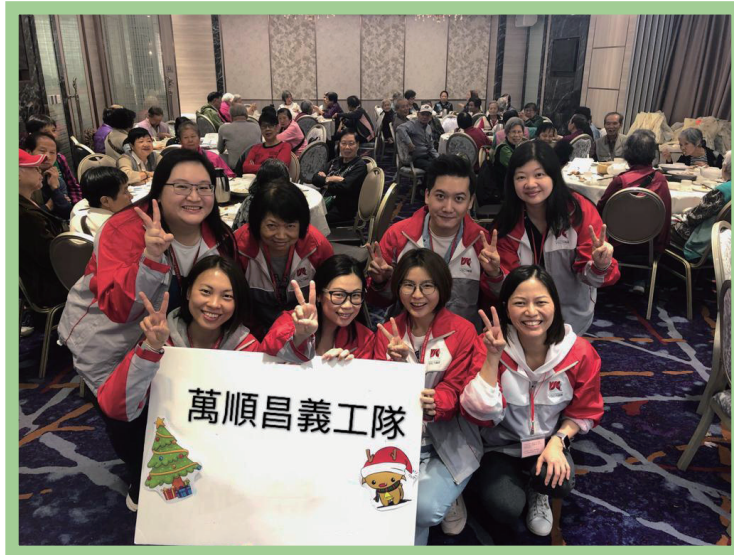
由香港家庭福利會舉辦的義工活動

於本報告期內，本集團為慈善活動作出貢獻及參與義工活動，其中包括但不限於由香港家庭福利會舉辦的活動及中銀香港 Outward Bound® 的外展衝勁樂 2018。