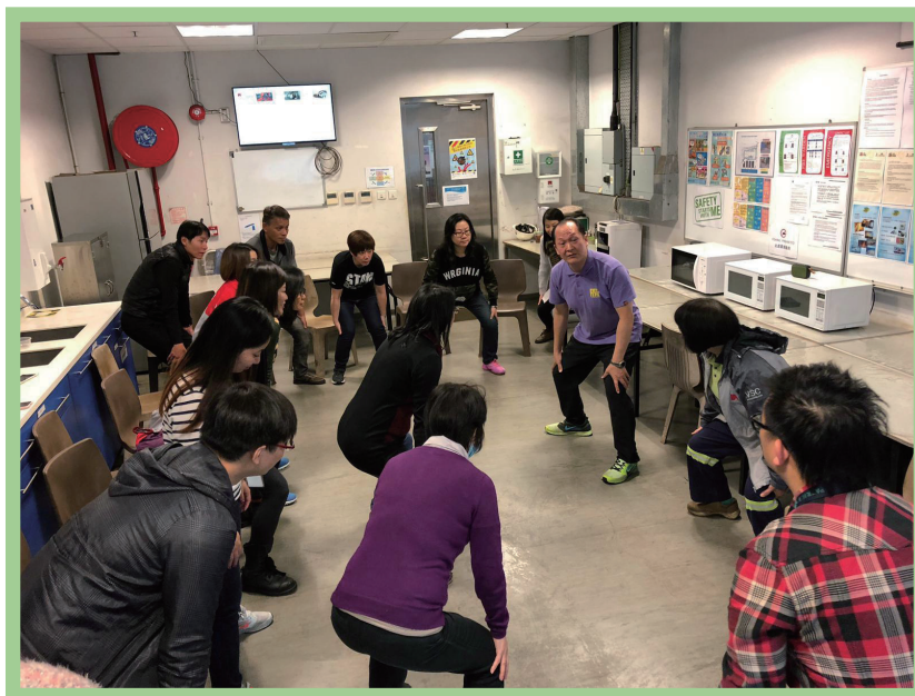
公司活動：至fit達人工作坊