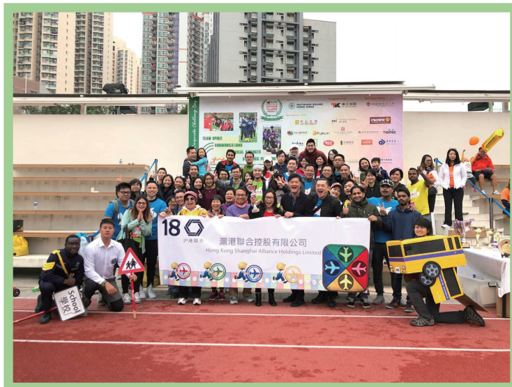
由中銀香港舉辦的外展衝勁樂 2018