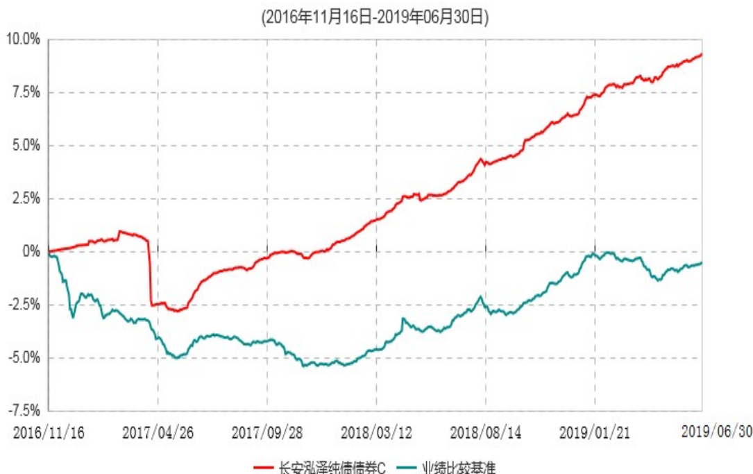
长安泓泽纯债债券C累计净值增长率与业绩比较基准收益率历史走势对比图

本基金基金合同生效日为 2016 年 11 月 16 日，按基金合同规定，本基金自基金合同生效起 6 个月为建仓期，截止到建仓期结束时，本基金的各项投资组合比例已符合基金合同的相关规定。基金合同生效日至报告期期末，本基金运作时间已满一年，图示日期为 2016 年 11 月 16 日至 2019 年 6 月 30 日。