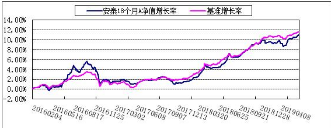
博时安泰 18 个月定开债 C