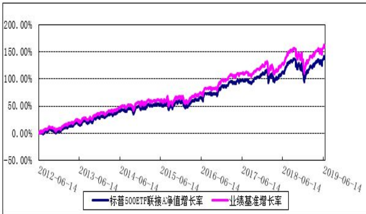
博时标普 500ETF 联接 C