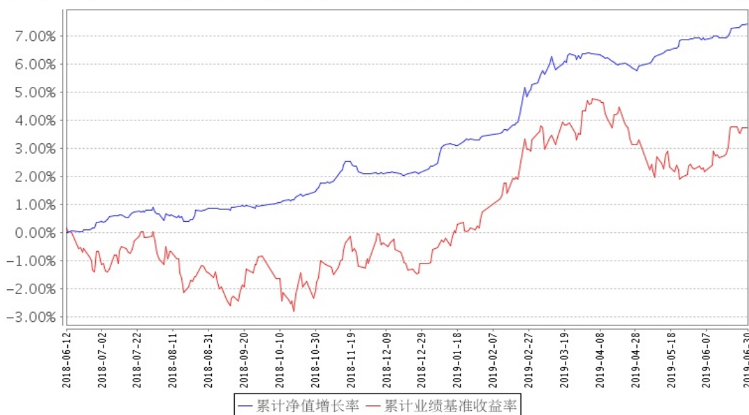
安信永鑫增强债券A累计净值增长率与同期业绩比较基准收益率的历史走势对比图