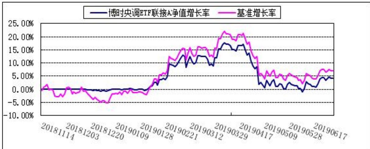
博时央调 ETF 联接 C