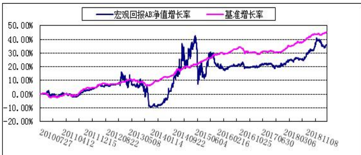
博时宏观回报债券 C