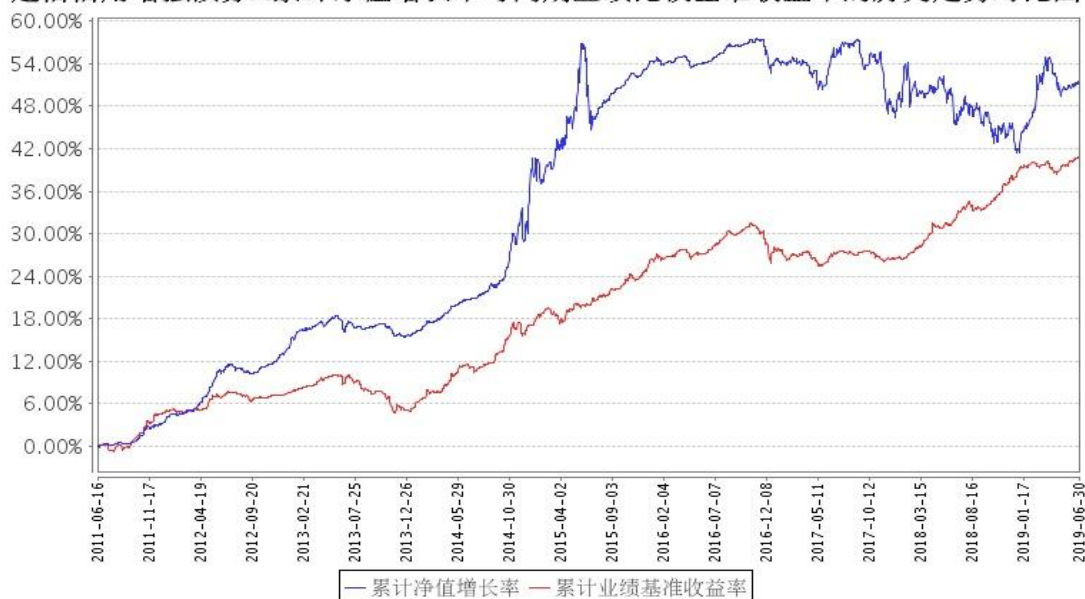
建信信用增强债券A累计净值增长率与同期业绩比较基准收益率的历史走势对比图