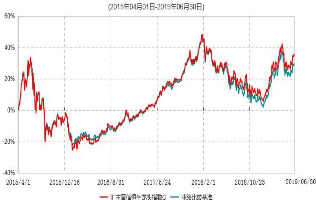
汇丰晋信恒生龙头指数C累计净值增长率与业绩比较基准收益率历史走势对比图