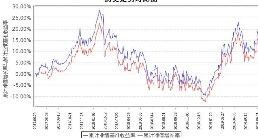
图 1：嘉实富时中国 A50ETF 联接基金 A 类基金份额累计净值增长率与同期业绩比较基准收益率的历史走势对比图