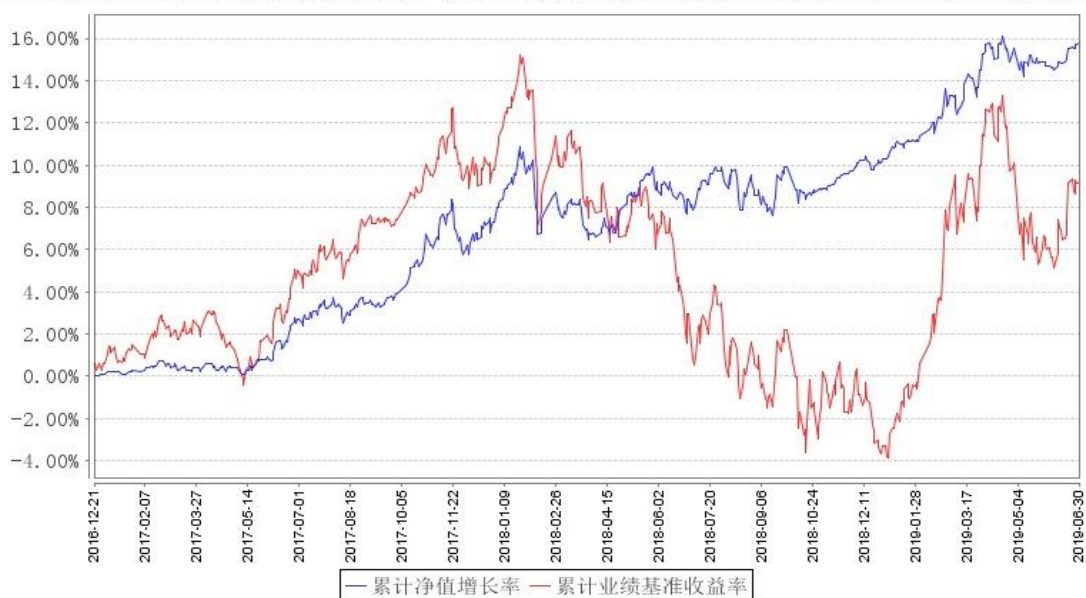
汇添富新睿精选混合A累计净值增长率与同期业绩比较基准收益率的历史走势对比图