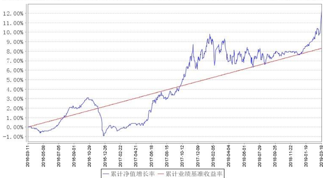
汇添富盈鑫保本混合累计净值增长率与同期业绩比较基准收益率的历史走势对比图

注:本基金建仓期为本《基金合同》生效之日(2016年3月11日起)起6个月,建仓期结束时各项资产配置比例符合合同规定;本基金于2019年03月19日变更注册为汇添富盈鑫灵活配置混合型证券投资基金。