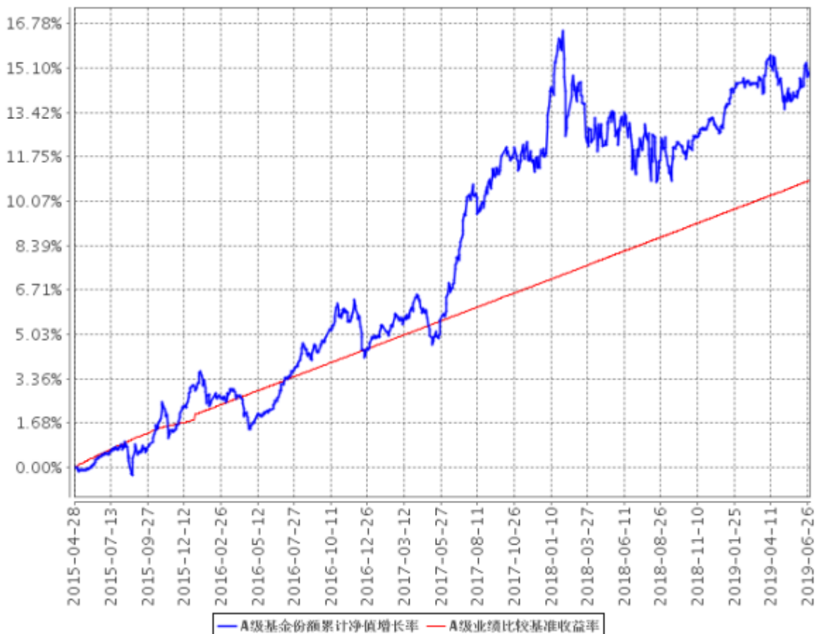
A级基金份额累计净值增长率与同期业绩比较基准收益率的历史走势对比图