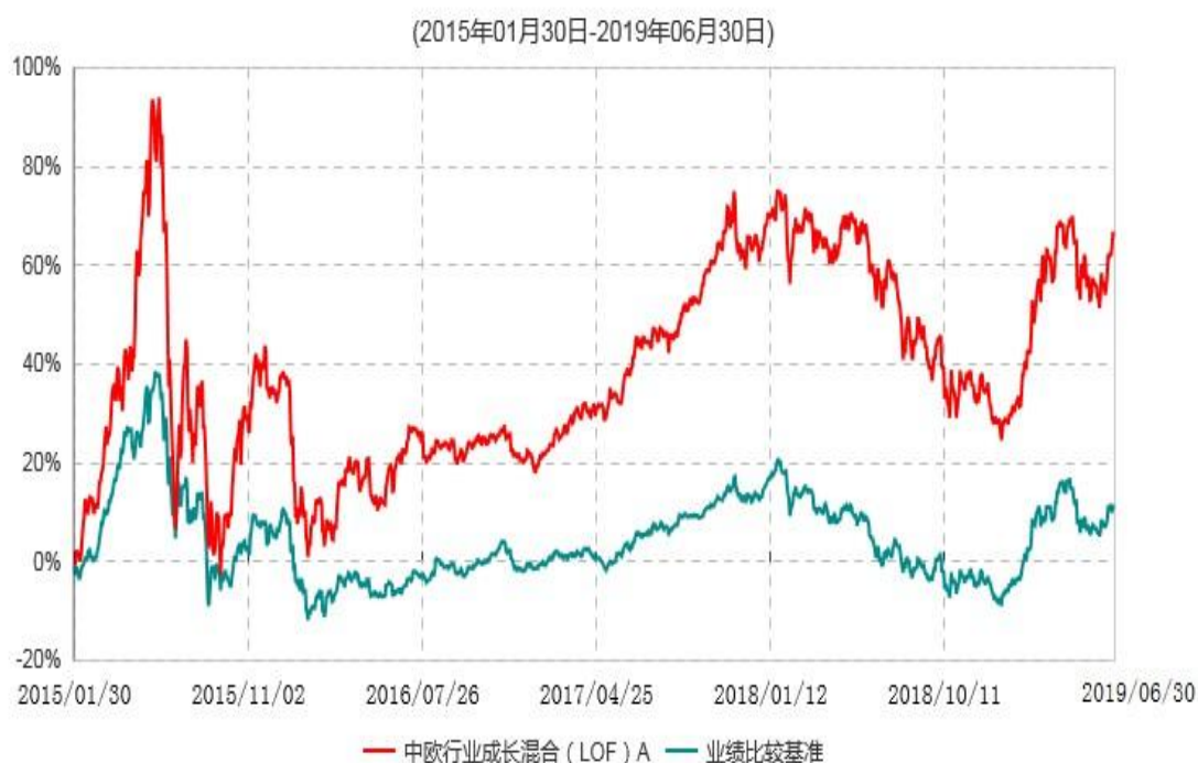
中欧行业成长混合(LOF)A累计净值增长率与业绩比较基准收益率历史走势对比图