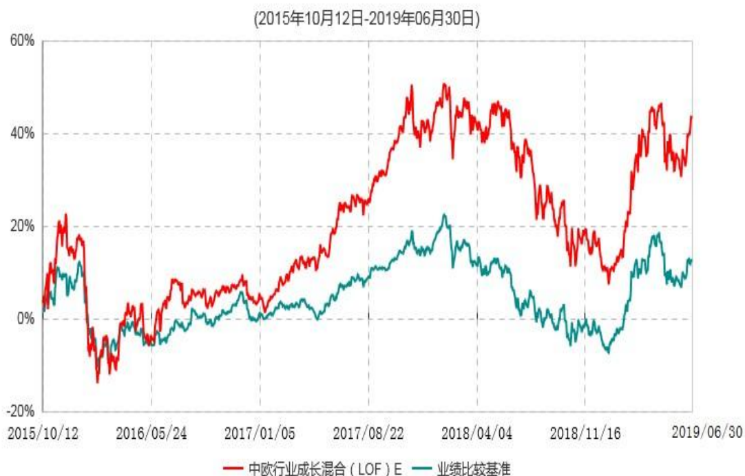
中欧行业成长混合(LOF)E累计净值增长率与业绩比较基准收益率历史走势对比图

注：本基金自2015年10月8日新增E类份额，图示日期为2015年10月12日至2019年06月30日。