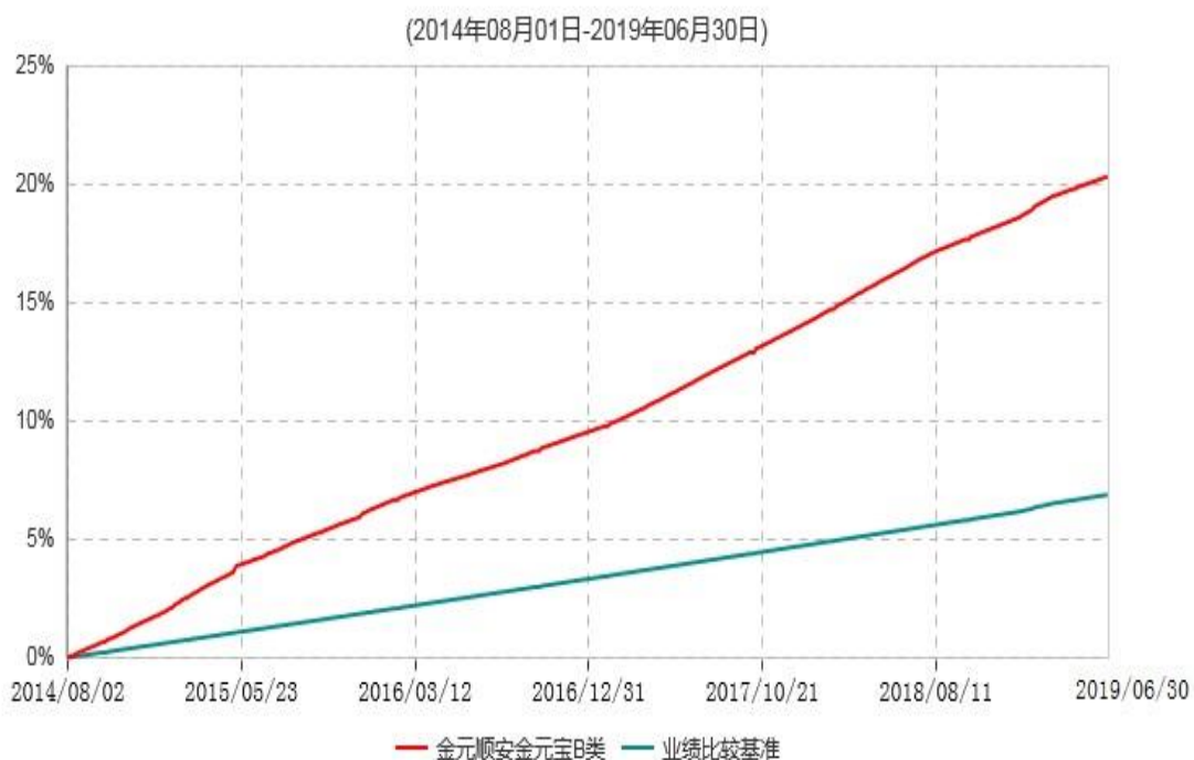
金元顺安金元宝B类累计净值收益率与业绩比较基准收益率历史走势对比图