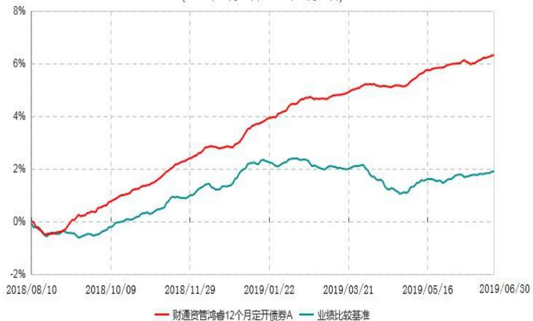
财通资管鸿睿12个月定开债券A累计净值增长率与业绩比较基准收益率历史走势对比图 (2018年08月10日-2019年06月30日)