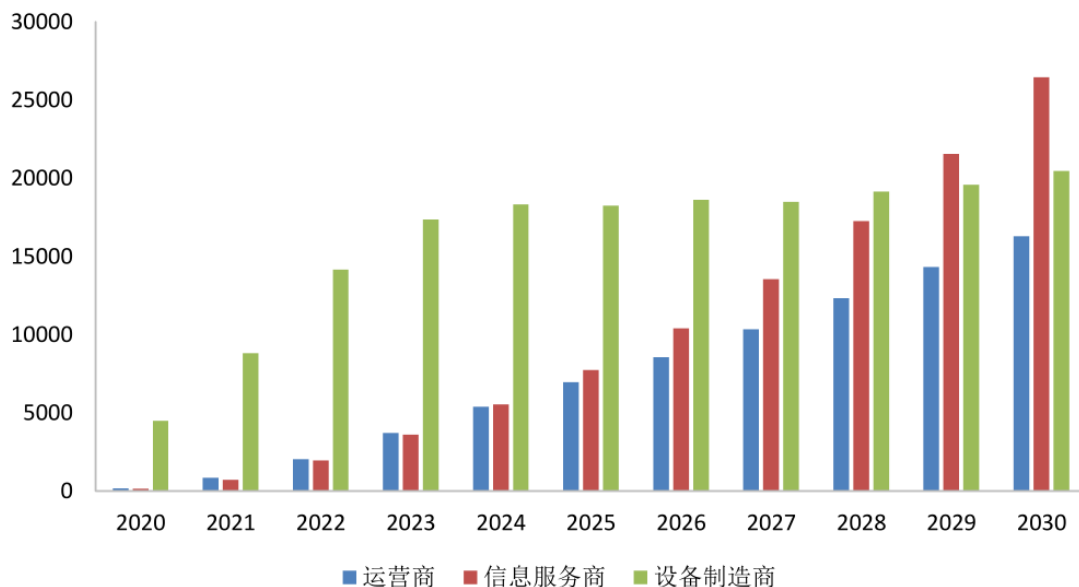
5G 直接经济产出结构（亿元）