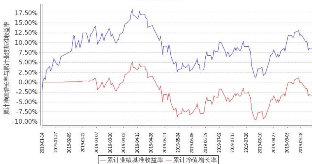
图 2：嘉实港股通新经济指数(LOF)C 基金份额累计净值增长率与同期业绩比较基准收益率的历史走势对比图