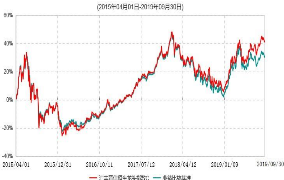
汇丰晋信恒生龙头指数C累计净值增长率与业绩比较基准收益率历史走势对比图