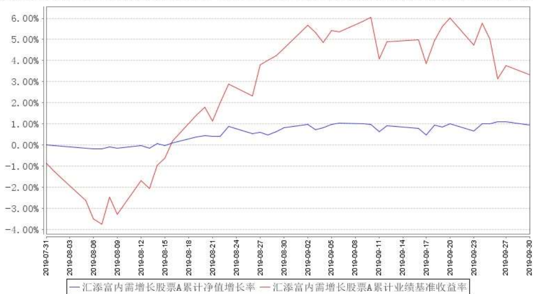
汇添富内需增长股票A累计净值增长率与同期业绩比较基准收益率的历史走势对比图