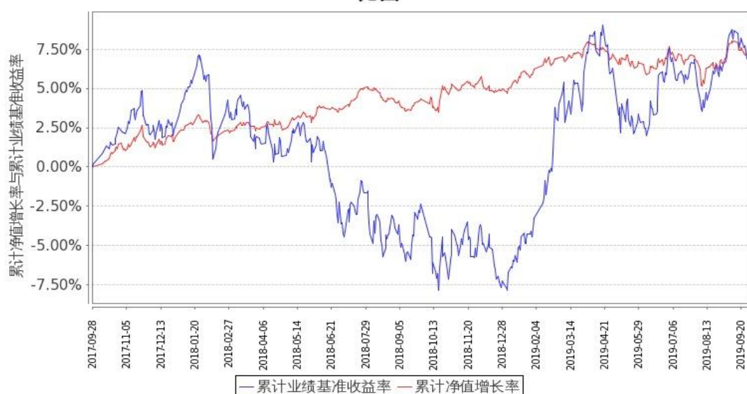
嘉实新添辉定期混合C累计净值增长率与同期业绩比较基准收益率的历史走势对比图