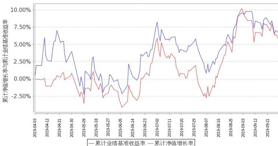
图 2：嘉实消费精选股票 C 基金份额累计净值增长率与同期业绩比较基准收益率的历史走势对比图