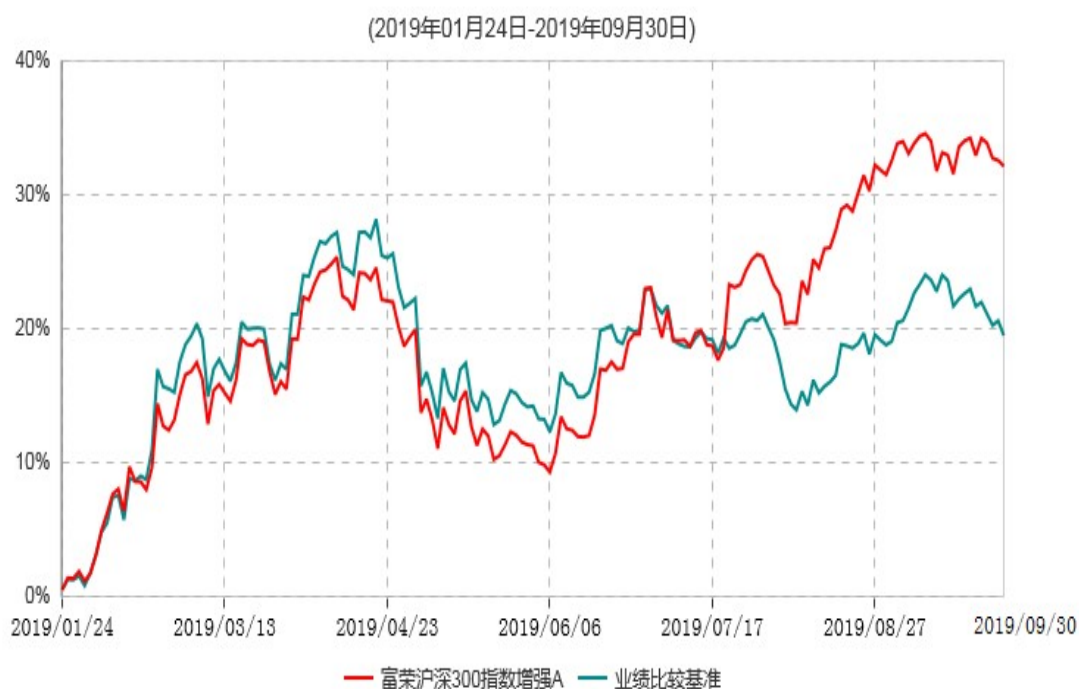
富荣沪深300指数增强A累计净值增长率与业绩比较基准收益率历史走势对比图