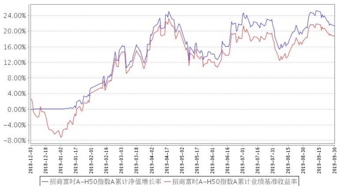
招商富时A-H50指数A累计净值增长率与同期业绩比较基准收益率的历史走势对比图