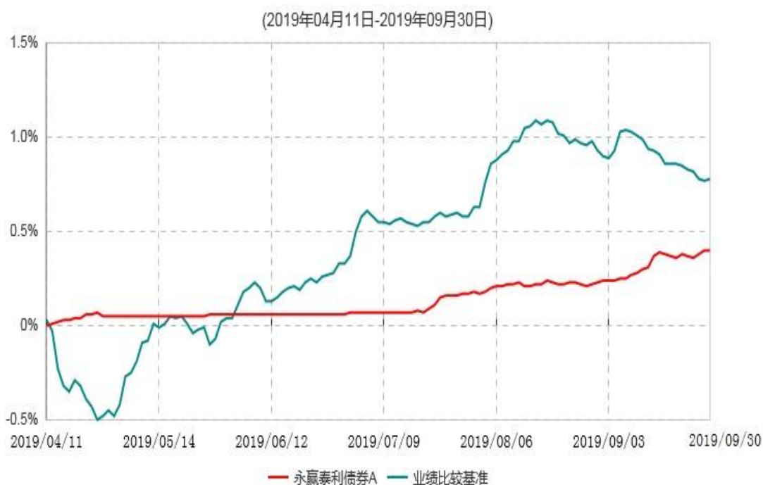
永赢泰利债券A累计净值增长率与业绩比较基准收益率历史走势对比图

注：1、本基金合同生效日为 2019 年 04 月 11 日，截至本报告期末本基金合同生效未满 1 年； 2、本基金建仓期为本基金合同生效日起 6 个月，截至本报告期末，本基金尚处于建仓期中。