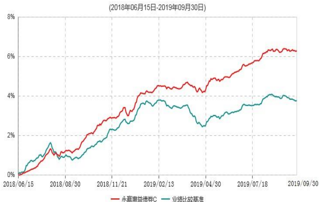
永赢惠益债券C累计净值增长率与业绩比较基准收益率历史走势对比图