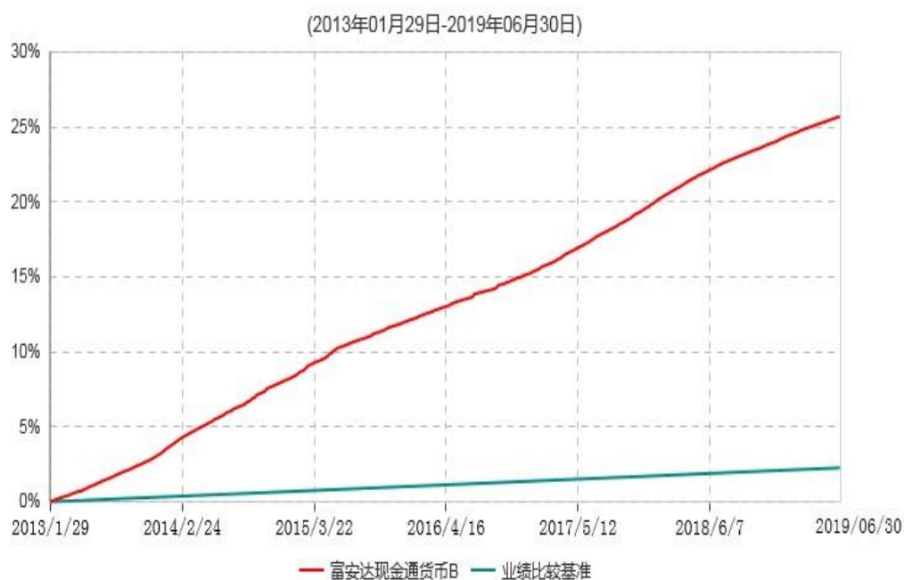
富安达现金货币B累计净值收益率与业绩比较基准收益率历史走势对比图