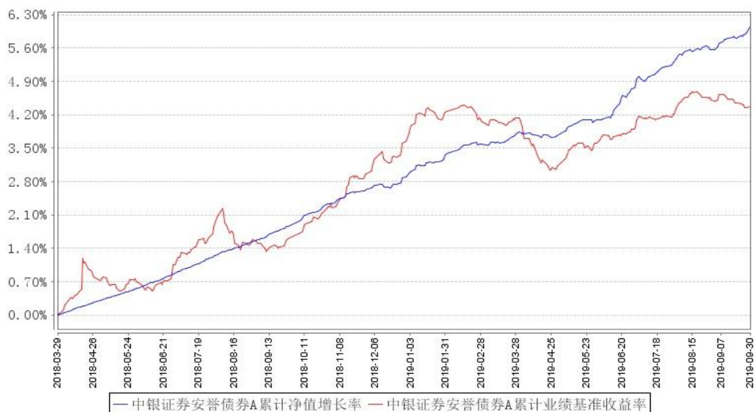
中银证券安誉债券A累计净值增长率与同期业绩比较基准收益率的历史走势对比图