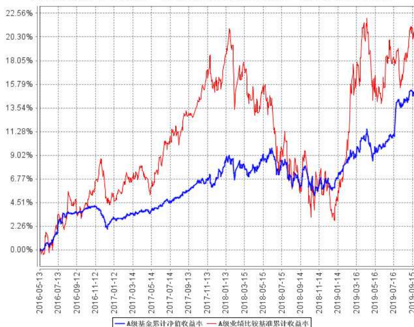
A级基金累计净值收益率与同期业绩比较基准收益率的历史走势对比图