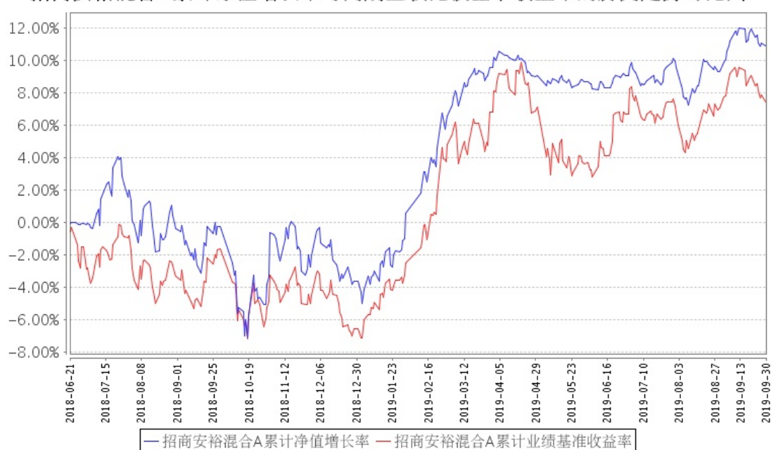
招商安裕混合A累计净值增长率与同期业绩比较基准收益率的历史走势对比图