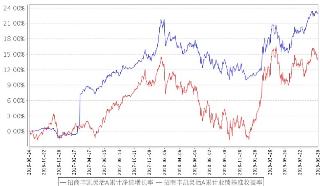
招商丰凯灵活A累计净值增长率与同期业绩比较基准收益率的历史走势对比图